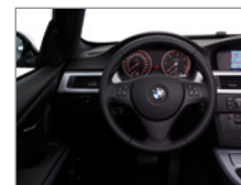
Gros plan - Volant