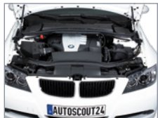
Vue du compartiment moteur

Pour un meilleur résultat, utilisez de préférence le flash pour photographier le moteur et le coffre. Pour une photographie détaillée des jantes, mettez les roues droites.