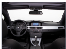
Vue de l'habitacle de devant