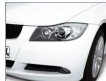
Gros plan - Phare et jante