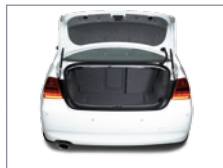
Vue du coffre (éventuellement avec la roue de secours)