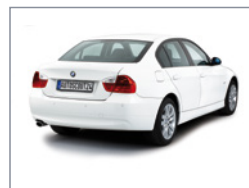
Vue d'angle à 45° de derrière