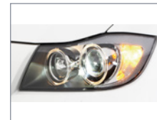
Gros plan - Phare