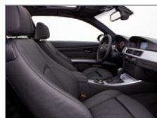
Vue de l'habitacle de côté