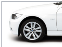
Gros plan - Jantes