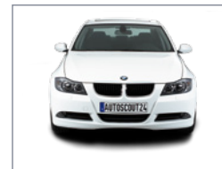
Vue de devant