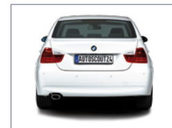
Vue de derrière