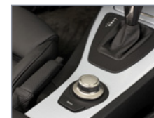
Point de vue différent de l'habitacle Navigation