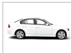
Vue du côté droit