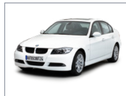
Vue d'angle à 45° de devant

Le véhicule doit être visible sous tous les angles et être éclairé uniformément. Pour prendre une photo de biais, tournez légèrement les jantes vers l'objectif. Lorsque vous photographiez le véhicule de face, de côté ou de derrière, vérifiez que les roues soient droites.