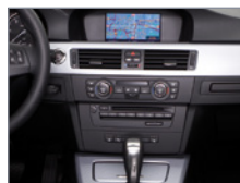
Gros plan - Infodivertissement